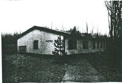
▼ Pohľad zo dvora areálu na Hotel Tenis - severovýchodný