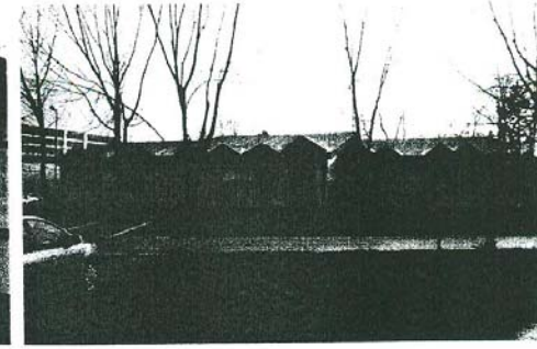
▼ Pohľad z Ďumbierskej ulice na Hotel Tenis - severozápadný