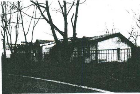
▼ Pohľad z Ďumbierskej ul. na budovu Hotela Tenis - západný