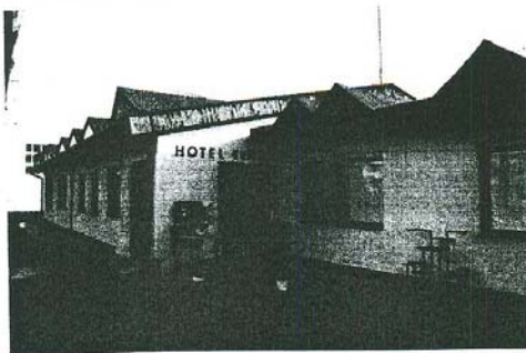
▼ Pohľad zo dvora areálu na Hotel Tenis - severovýchodný